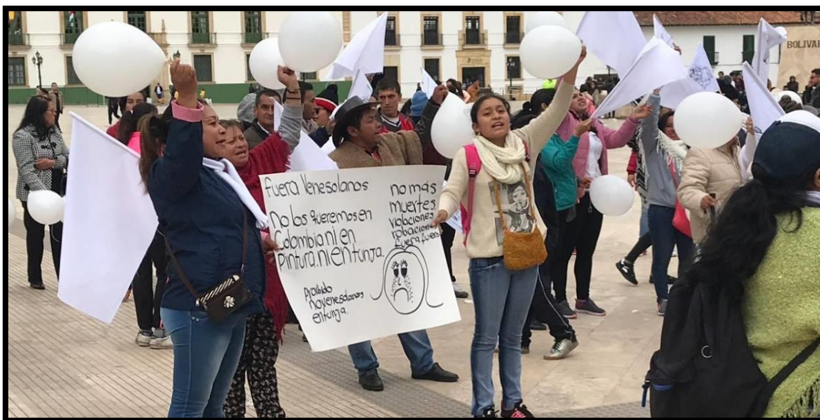
Figura 2. Marcha contra los migrantes.

Ejemplo: 23 de agosto de 2019 Marcha en contra de los migrantes en Tunja