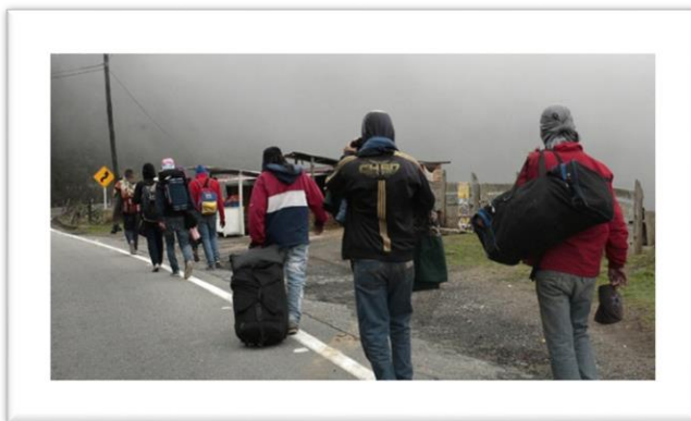
Figura 3. Migrantes, Fuente: La Opinión. (2018). Caminar o morir: el drama de los migrantes. Recuperado de: https://www.laopinion.com.co/frontera/caminar-o-morir-el-drama-de-los-migrantes- .

Se hace una caracterización de acuerdo a sus necesidades y así, establecer de qué manera se brindará la primera ayuda de acuerdo a los recursos con los que se cuente para poder ayudar.